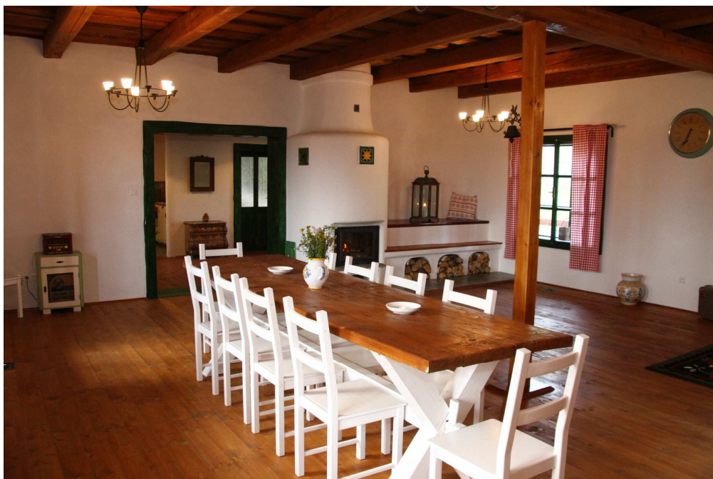
Ukážka ubytovania na súkromí, Jasienka – Bratkovica