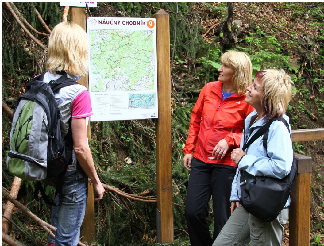
Náučný chodník na vodopád Bystré