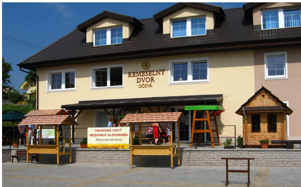
Remeselný dvor Očová – centrum ukážky a výučby tradičných remesiel