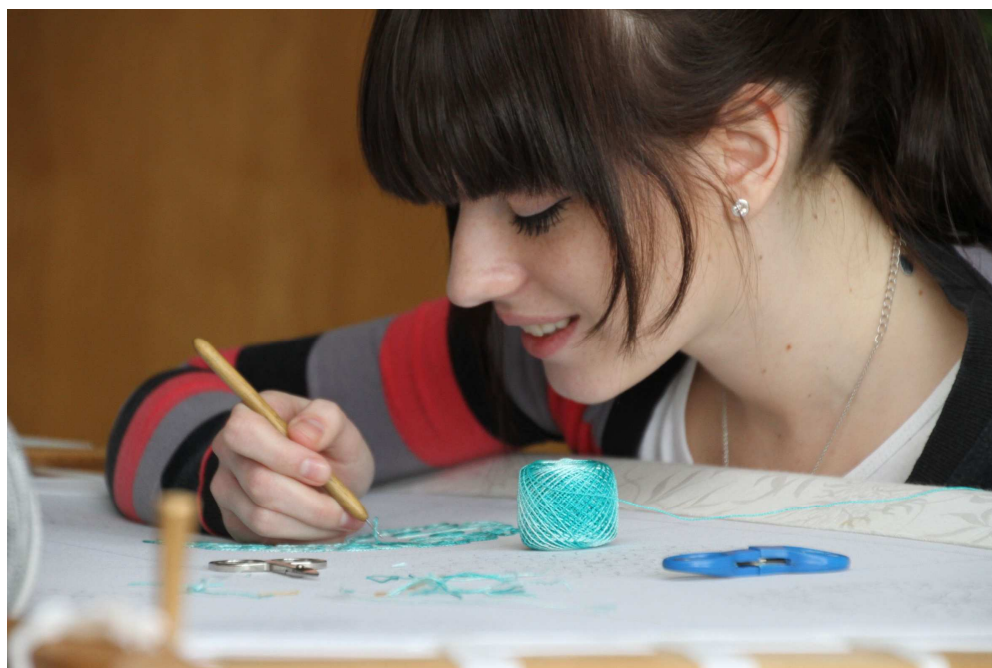
Ukážka výučby vyšívania krivou ihlou