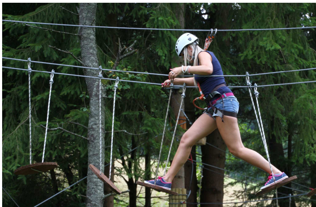
Lanové centrum Košútka