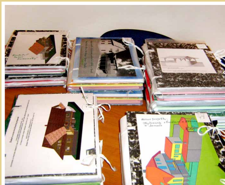
Prijaté žiadosti o finančnú podporu