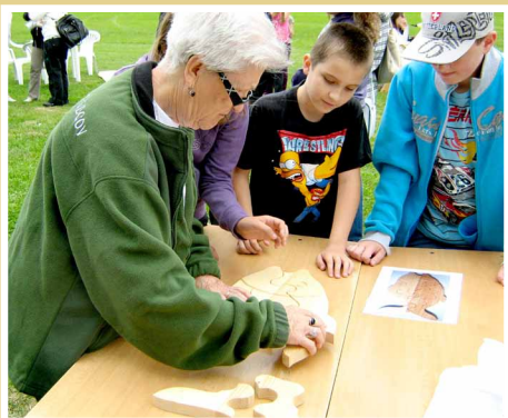
„Seniori na krídlach“ zrealizoval DS Dolinka v Očovej v rámci projektu socialnej inklúzie