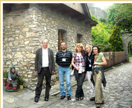
Účastníci medzinárodného stretnutia MAS LEADERFEST 2011, Štramberg ČR