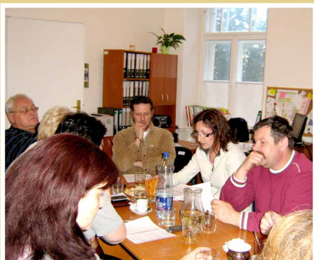
Zasadenie Riadiaceho orgánu MAS

15. 11. 2011 prebehli voľby do Monitorovacieho výboru z dôvodu uplynutia 3 ročného funkčného obdobia. Riadiaci orgán MAS potvrdil doterajších členov pre činnosť na nasledujúce funkčné obdobie.