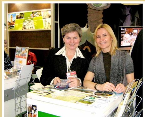
Prezentácia Podpoľania na výstave ITF Slovakiatour 2011