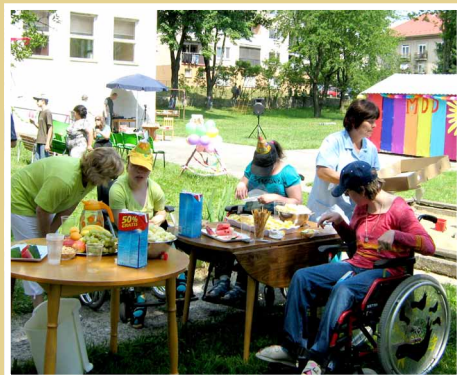
„Záhrada plná smiechu a detských hier“ zrealizoval DSS Detva