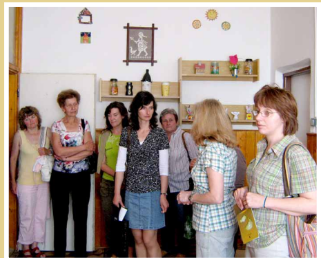
Pracovná cesta lídrov SI Podpoľania v LPSI Brezno