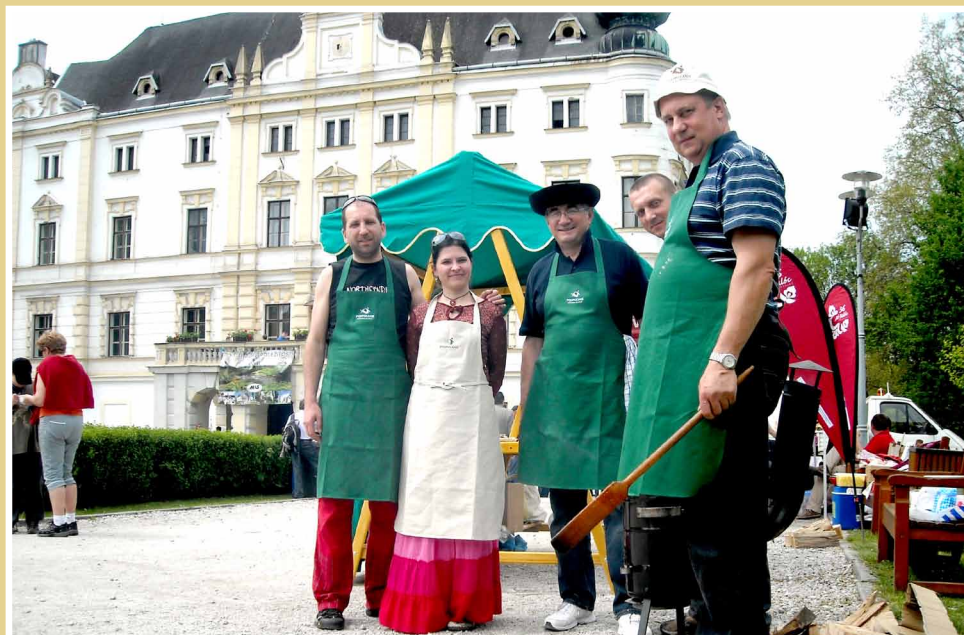
Prezentácia prípravy tradičných produktov Podpoľania v MAS Regiónu Poodří