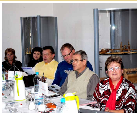
Záverečný workshop partnerstva sociálnej inklúzie