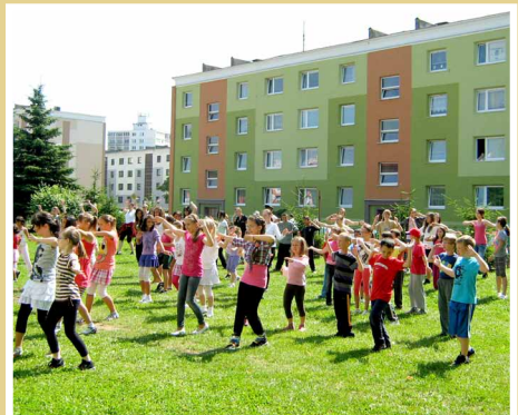
„Zacvičme si zumbu“ zrealizovala ŠZŠ Detva v rámci projektu socialnej inklúzie