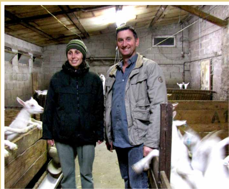
Výmena skúseností slovenských farmárov na farmách vo Francúzsku