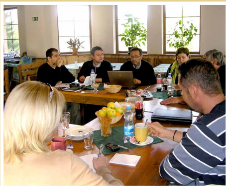
Pracovný seminár zástupcov CR z Podpoľania a MAS Malohont s odborníkmi z Francúzska