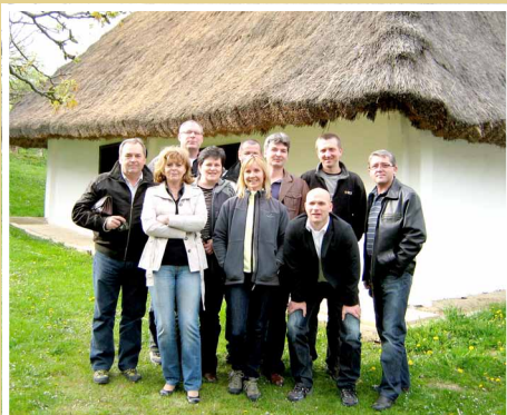
Odborná exkurzia v regióne Burgenland v Rakúsku