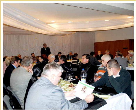
Zasadnutie Valného zhromaždenia OZ Podpoľanie