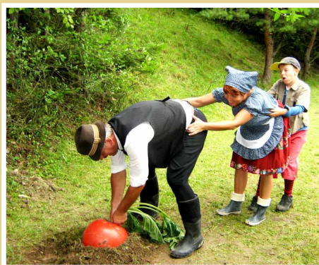
„Cesta rozprávkovým lesom“ zrealizovala obec Stožok v rámci projektu socialnej inklúzie