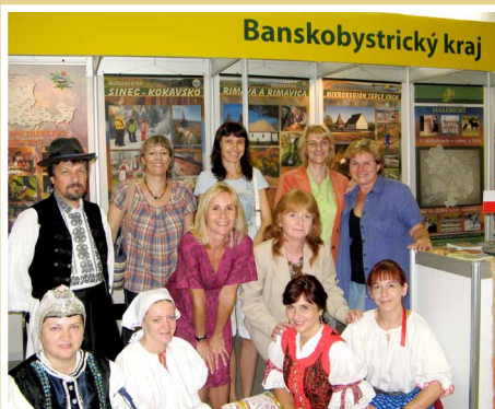
Prezentácia Podpoľania na výstave Agrokomplex Nitra