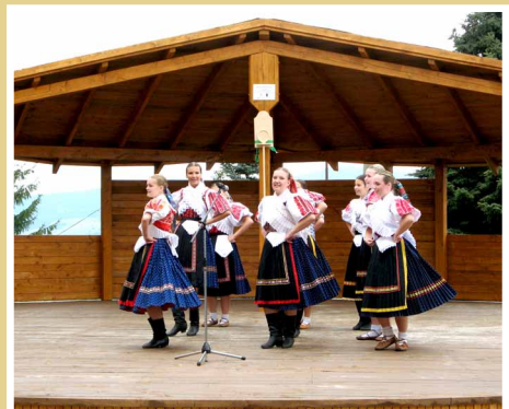
Amfiteáter v Detvianskej Hute, zrealizovaný v rámci programu LEADER