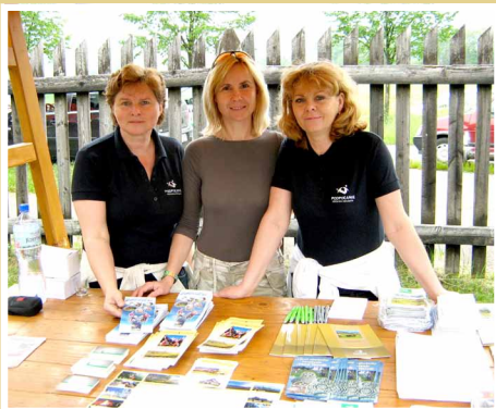
Manažment MAS na podujatí Sviatok pod Poľanou

Manažment MAS zabezpečuje implementáciu integrovanej stratégie „4P - Program pre príťažlivé Podpoľanie“. Súčasťou práce je príprava a vyhlasovanie výziev, poskytovanie konzultácií žiadateľom o finančnú podporu, administrácia prijatých projektov. Manažment MAS sa aktívne zúčastňuje na pracovných stretnutiach a zabezpečuje propagačno - vzdelávacie aktivity pre zvyšovanie zručností členov a spolupracovníkov MAS.