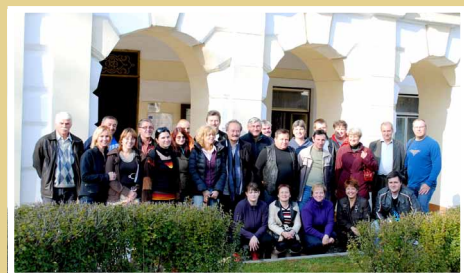
Členovia Podpoľania v MAS Regióne Poodří

OZ Podpoľanie s partnerom 36 Jó Palóc v roku 2011 pripravilo spoločný projekt slovensko - maďarskej spolupráce zameraný na podporu riešenia zamestnanosti v oboch územiach. Projekt sa zatiaľ posudzuje.