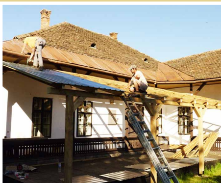
„Zakryme si pódium“ zrealizovala obec H. Tisovník v rámci projektu socialnej inklúzie