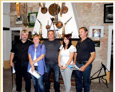
Odborná exkurzia v regióne Marche v Taliansku