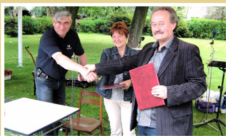
Podpis partnerskej zmluvy troch MAS v Bartošoviciach