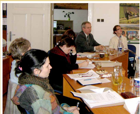
Školenie výberovej komisie MAS

Výberová komisia sa zostavuje vždy pre vyhlásenú výzvu