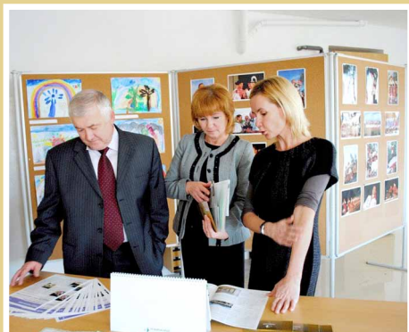
Prezentácia MAS Podpoľanie na Dni otvorených dverí v Remeselnom Dvore v Očovej