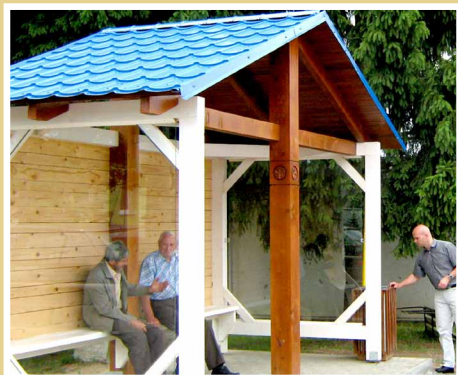
Autobusová zastávka v Korytárkach, zrealizované v rámci programu LEADER