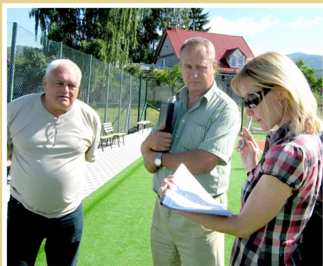
Monitoring zrealizovaného projektu v obci Dúbravy v programe LEADER