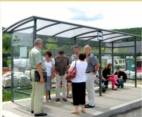
Autobusové zastávky vo Víglaši, zrealizované v rámci programu LEADER