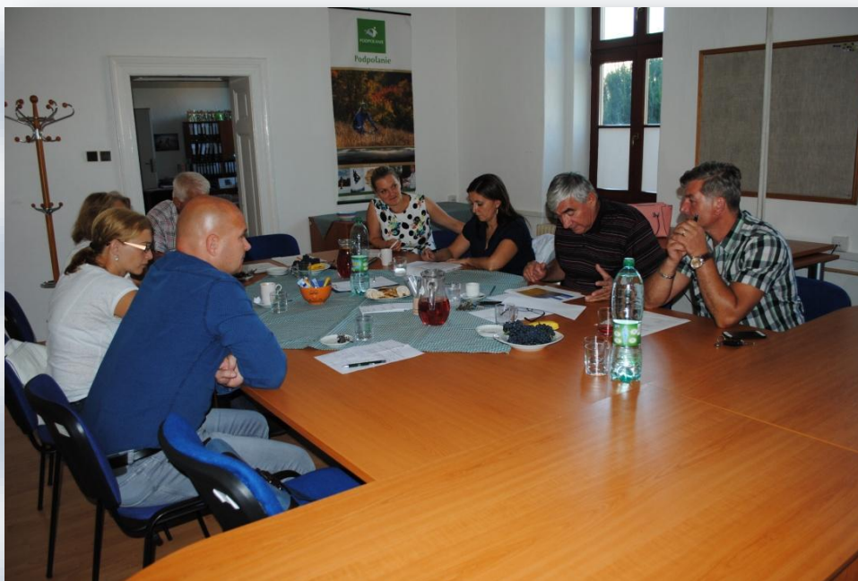
Zasadnutie Správnej rady – Detva 08. 09. 2016