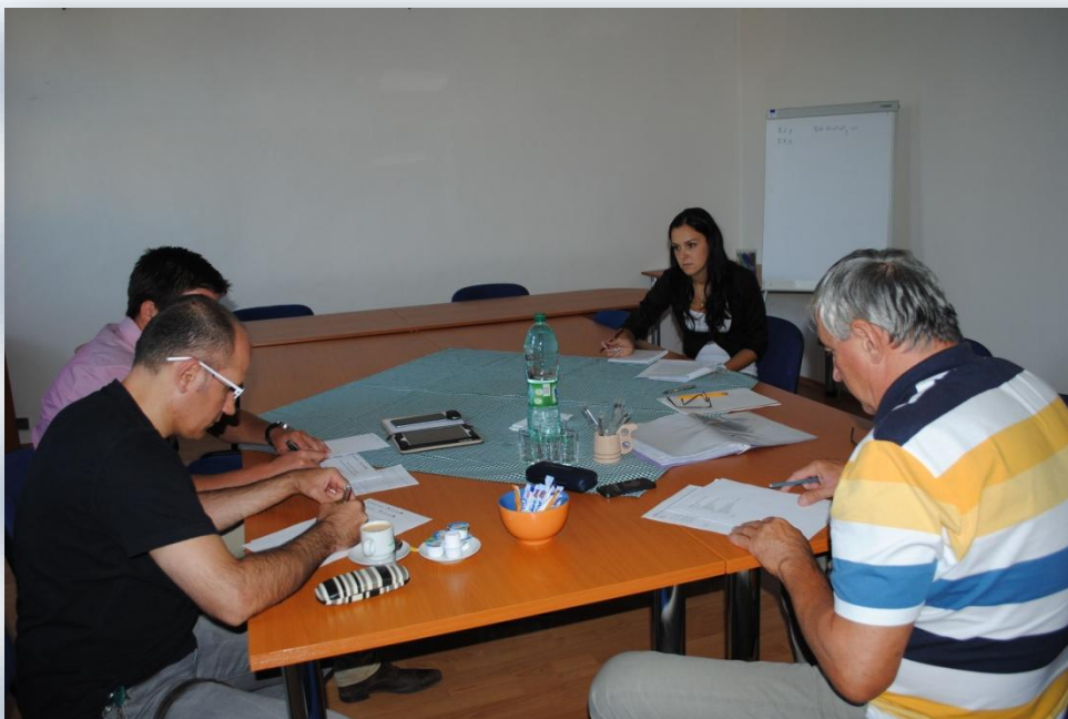
Pracovné stretnutie k projektu – Detva 09. 09. 2016

Obidva projekty sú naplánované na obdobie 06/2017 – 05/2019. Projekty boli podané do 3. Novembra. Súčasťou realizácie projektov sa uskutočnili pracovné stretnutia na oboch stranách.