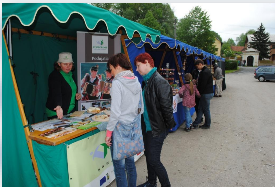
Poodří – účasť na podujatí Oteváraní Poodří

Výdavky občianskeho združenia vo výške 28 679,19 € sú v prevažnej miere účelovo viazané na príjmy z ktorých boli poskytnuté a nemožno ich presúvať do iných položiek.