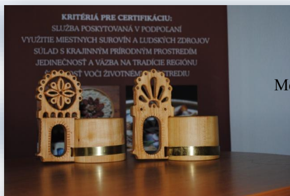
Detviensky drevený črpák

Med kvetový, agátový, lipový, medovicový, peľ